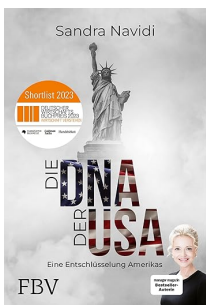
USA's DNA: Hvordan fungerer Amerika?