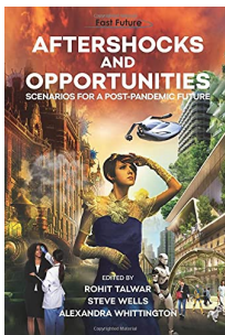
Nachbeben und Chancen: Szenarien für eine Zukunft nach der Pandemie