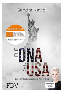
El ADN de EE. UU.: ¿Cómo funciona Estados Unidos?