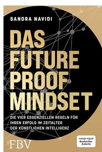
La mentalidad preparada para el futuro