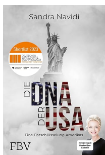
L'ADN des États-Unis : comment fonctionne l'Amérique ?