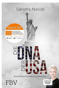
Il DNA degli Stati Uniti: come funziona l'America?