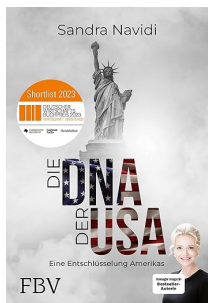
O ADN dos EUA: Como funciona a América?