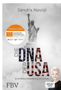
USA:s DNA: Hur fungerar Amerika?